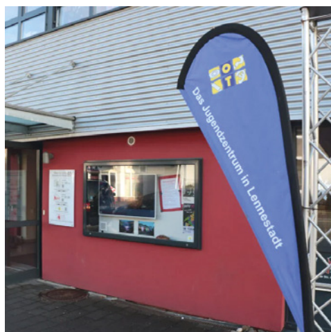
OT Grevenbrück, JuLeS. e. V. https://www.ot-grevenbrueck.de/ Lennestadt-Grevenbrück, Südwestfalen