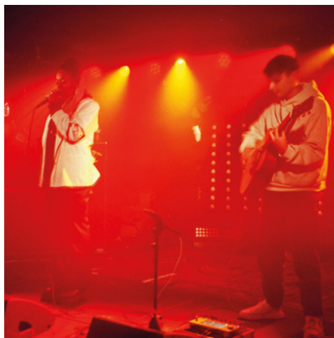
Beautiful Noise Siegen e. V. http://www.beautiful-noise-siegen.de/ Siegen, Südwestfalen