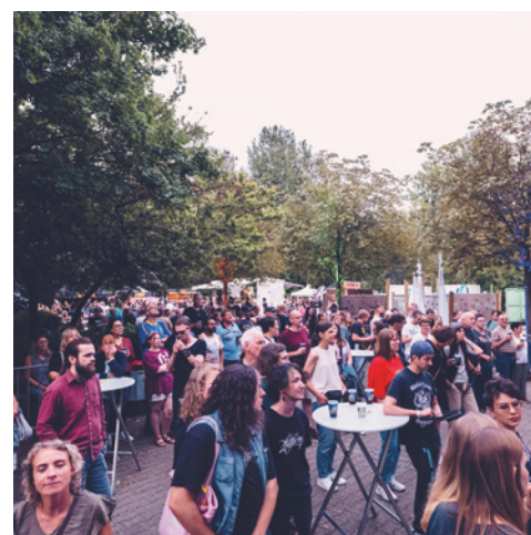
Laut & Lästig e. V. https://openair.lul-ev.de/ Kamen, Hellweg