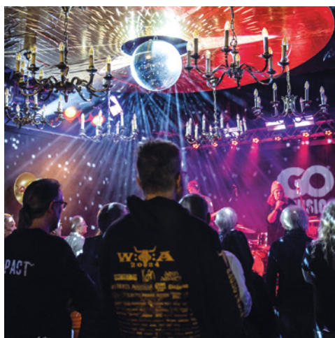
Rockin' Rooster Musikclub e. V. https://rockinroosterclub.de/ Haan, Bergisches Land