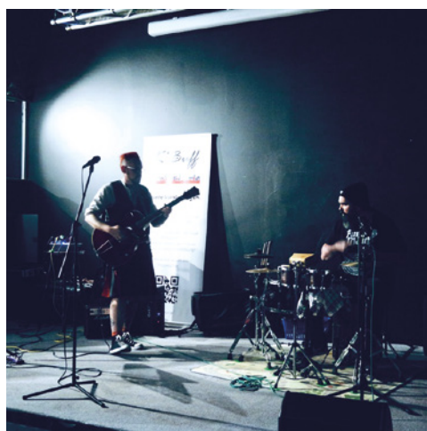
K*Buff – Verein für Kleinkunst und Subkultur https://www.kbuff.de/ Neuss, Niederrhein