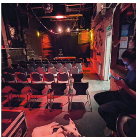
Waldmeister e. V. https://www.waldmeister-solingen.de/ Solingen, Bergisches Land