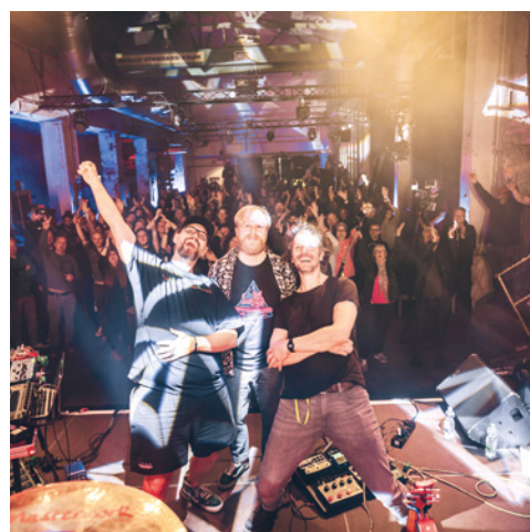
WareHouseStage e. V. https://warehousestage.de/ Gummersbach, Bergisches Land