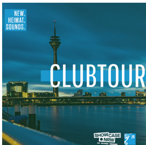
New Heimat Sounds http://new-heimat-sounds.de/ Sankt Augustin, Rheinschiene © New Heimat Sounds Clubtour 2024