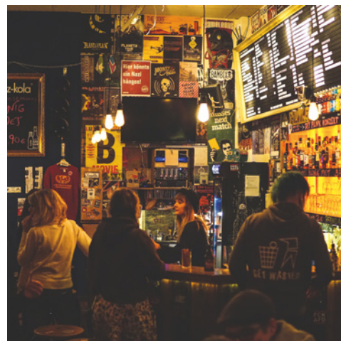
Kulturzentrum Pelmke e. V. https://www.pelmke.de/ Hagen, Ruhrgebiet/Südwestfalen