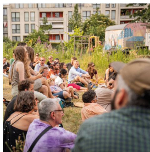
Musiknetzwerk Aachen e. V. https://musiknetzwerkaachen.de/ Aachen, Aachen © Unbekannt