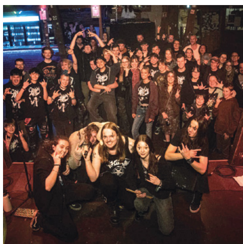
Pink Pop e. V./Jugendkulturzentrum Scheune https://jkz-scheune.de/ Ibbenbüren, Münsterland