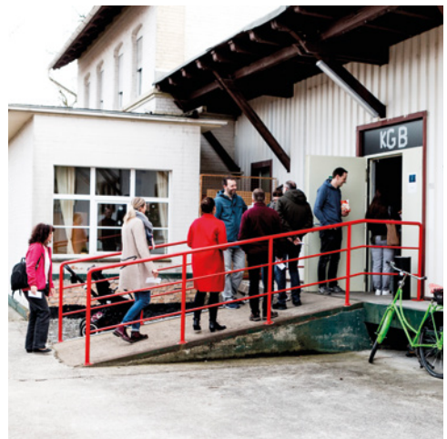
KulturGüterBahnhof, MusikZehner e. V. https://kgb-langenberg.de/ Langenberg, Ostwestfalen-Lippe