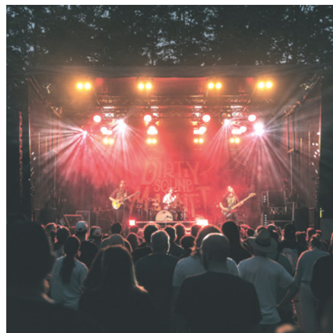
Trafostation 61 Festival, Kulturtrafo Frechen e. V. https://trafostation61.de/ Frechen, Rheinschiene