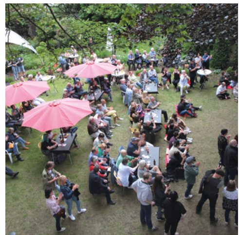
BIS - Zentrum für offene Kulturarbeit e. V. https://www.bis-zentrum.de/ Mönchengladbach, Niederrhein