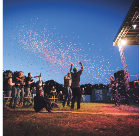
Hembser Kulturverein e. V. https://kultur.hembsen.de/ Brakel-Hembsen, Ostwestfalen-Lippe