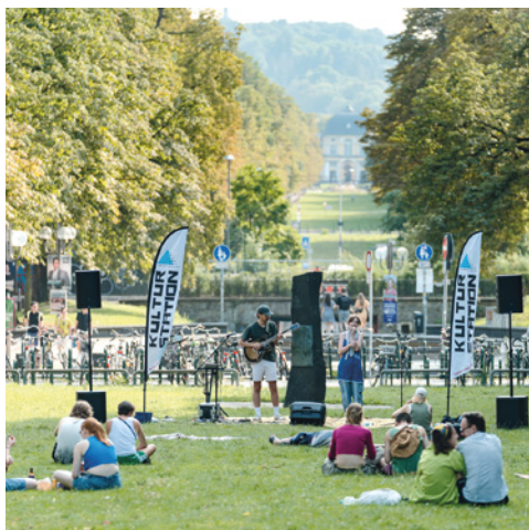
Kulturstation Bonn (ehemals Musikstation Bonn), Kleiner Muck e. V. https://www.die-musikstation.de/ Bonn, Rheinschiene