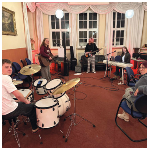
KultStädte e. V. https://www.kultstaedte.de/ Lüdenscheid, Südwestfalen