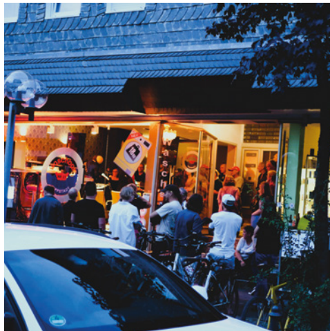
abseite e. V. https://abseite-festival.de/ Lippstadt, Hellweg

Die folgende Übersicht zeigt die Initiativen, die im Rahmen der zwischen September 2023 und September 2025 geführten Gespräche interviewt wurden. Die Popszene in Nordrhein-Westfalen ist reich, vielfältig und über alle Kulturregionen des Bundeslandes verstreut. In der Pop-Map NRW 2 sind weitere Vereine und Initiativen erfasst.