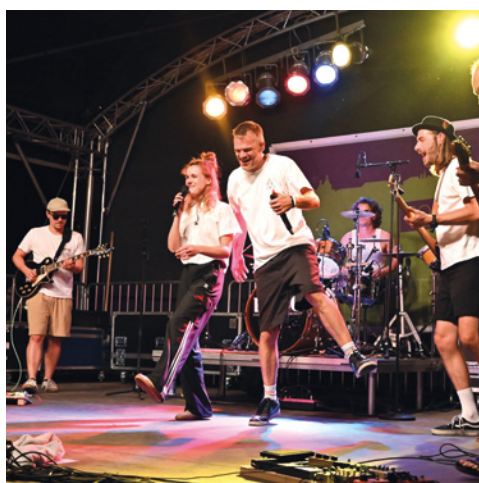
Rock- und Pop-Beauftragter der Stadt Bonn https://www.bonn.de/w/produkte/rock-und-pop-beauftragter.php Bonn, Rheinschiene