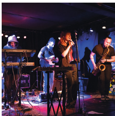
muensterbandnetz.de, ProKus e. V. https://muensterbandnetz.de/ Münster, Münsterland