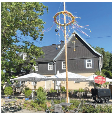
Kulturgut Schrabbenhof, MuT-Sauerland e. V. https://www.kulturgut-schrabbenhof.de/ Kirchhunden-Silberg, Südwestfalen