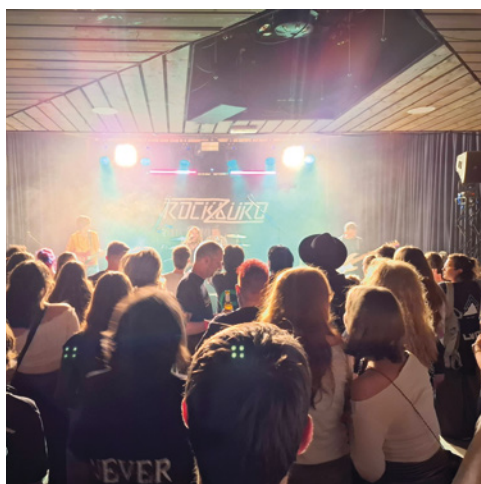
Rockbüro Haltern e. V. https://rockbuero-haltern.de/rockbuero Haltern am See, Ruhrgebiet