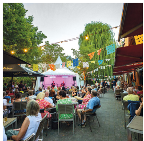
Kulturhaus Alter Schlachthof e. V. https://schlachthof-soest.de/ Soest, Hellweg